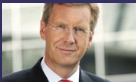
Christian Wulff, Ministerpräsident Niedersachsen

Global Business & Markets die Initiativen vorstellen, die neue Technologien und internationale Kooperationen fördern.