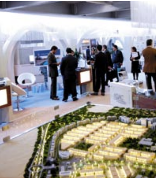
Globaler Player: Im Ausstellungsbereich der Global Business & Markets wird Abu Dhabi mit einer sehr großen Präsenz Investitions- und Kooperationsmöglichkeiten im Emirat vorstellen.